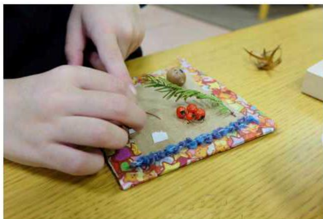
秋の工作週間には、拾ってきたドングリや木の実、葉っぱを使って色んな作品を作りました。