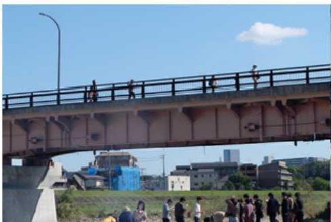
芋煮会場の牛越橋河原までは歩いて15分。橋の上から先遣隊を見つけて「おーい！」と手を振りました。