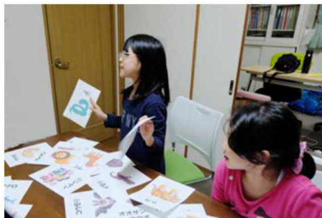
11月の学びクラブのテーマは「動物」です。この回は、哺乳類、爬虫類、鳥類の分類を学びました。