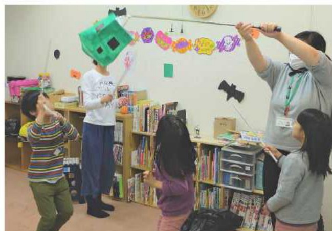
ハロウィンに紙袋でピニャータを作りました。思いっきり叩いて、割れると飴やチョコが降ってきます。