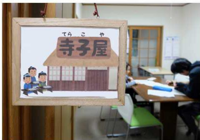
看板を下げればそこは寺子屋！ 宿題や自主学習をしたい子ども達が集まってきます。